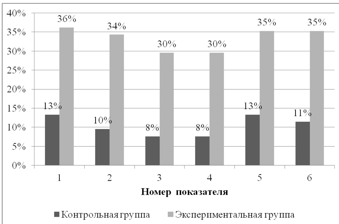
Диаграмма 3. Количество студентов в %, имеющих высокий уровень развития профессиональных коммуникативных умений по показателям на итоговом этапе