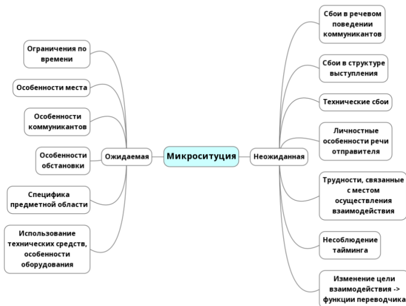
Рисунок 2. Структура микроситуации

На рисунке 2 представлена структура микроситуации межкультурного взаимодействия в устном переводе.