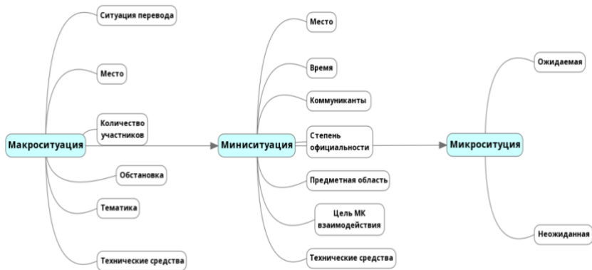
Рисунок 1. Структура ситуации межкультурного взаимодействия в устной переводческой деятельности

Многоуровневая структура ситуации межкультурного взаимодействия в устной переводческой деятельности представлена на рисунке 1.